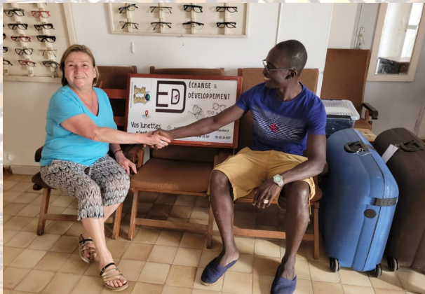
Maquette de l'enseigne de la boutique réalisée par Credo Sahel