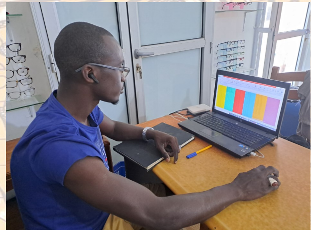
Ordinateur offert par un donateur